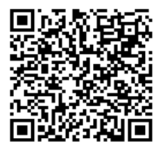
QR Code สแกนแผนที่